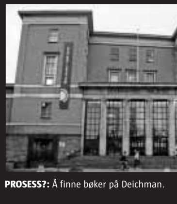
PROSESS?: Å finne bøker på Deichman.