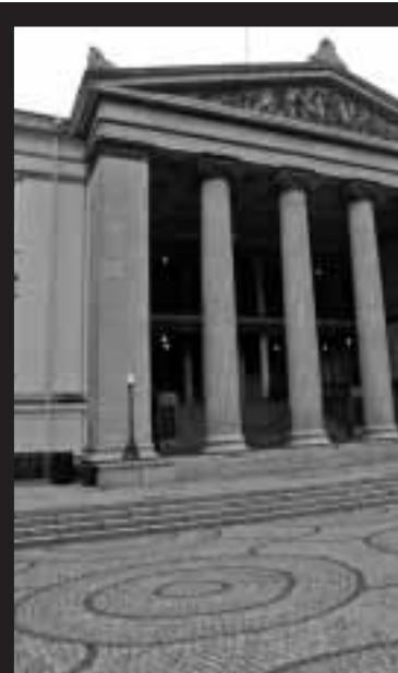
PROSESS?: Å gå på dagens universitet.

«Glem romanens høye status. Forestill deg heller at du er den første leseren»